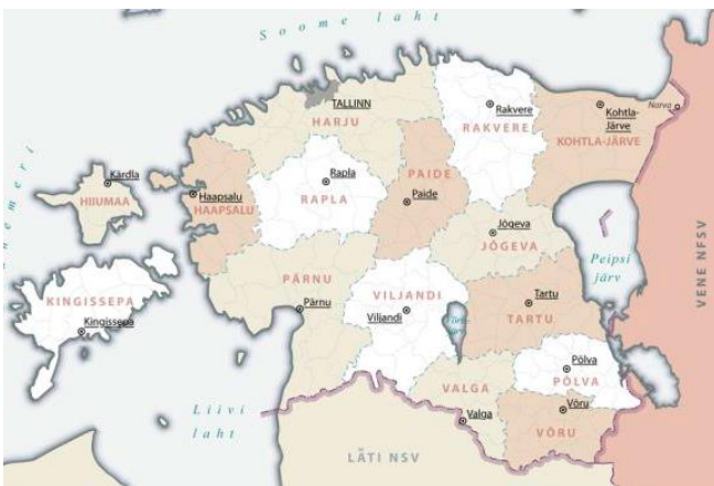
Eesti nõukogude okupatsiooni ajal (Eesti NSV haldusjaotus 1970. aastatel)